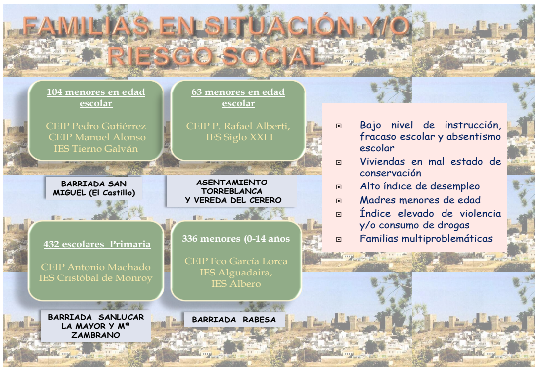
Tabla de elaboración propia

economía sumergida, inseguridad en las calles, escasa formación, mal estado de las viviendas, alto nivel de absentismo y fracaso escolar. Estas circunstancias llevan a intervenir de manera más específica, continuada, particular e integral en: la barriada “EL Castillo”, Barriada de Rabesa, Barriada Sanlúcar la Mayor y M a Zambrano.